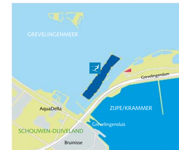
2 Grevelingenmeer: Grevelingendam