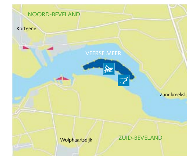
5 Veerse Meer