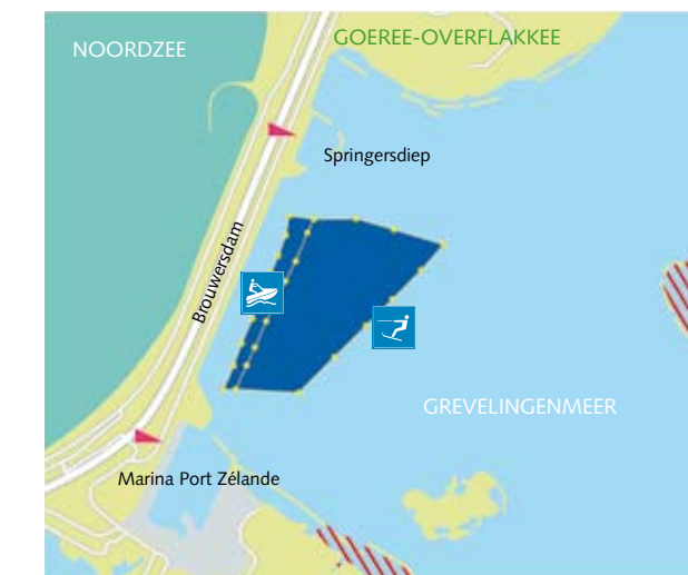
1 Grevelingenmeer: Brouwersdam

De gele drijfbakens zijn voorzien van het pictogram E.20.1. Uit praktische overwegingen zijn de andere verkeerstekens op of in het water niet aanwezig, maar ze kunnen wel voorkomen op bepaalde plaatsen op de oever.