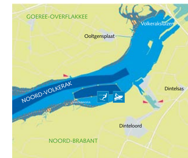
3 Krammer-Volkerak: Karolinageul